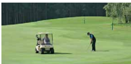
Seite 46 – Zum 17. Mal lockte das Sport-Wochenende auf den Golf- bzw. Tennisplatz in Bad Saarow – mit Ergebnissen