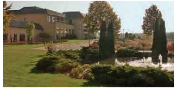
Seite 6 – Die Kammerversammlung beschloss unter anderem den Haushaltsplan für das Jahr 2013