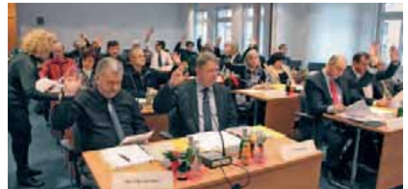
Seite 14 – Trotz der Jubiläumszahl wurde emsig gearbeitet während der 50. Vertreterversammlung der KZVLB