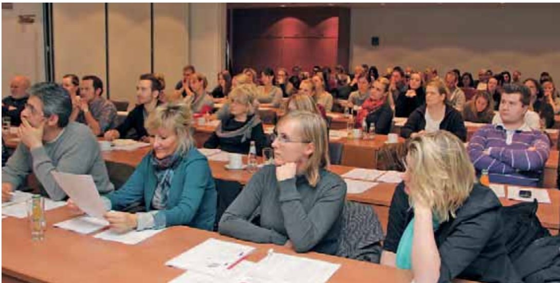
Ein langer, aber interessanter und informativer Abend für die 85 Teilnehmer.