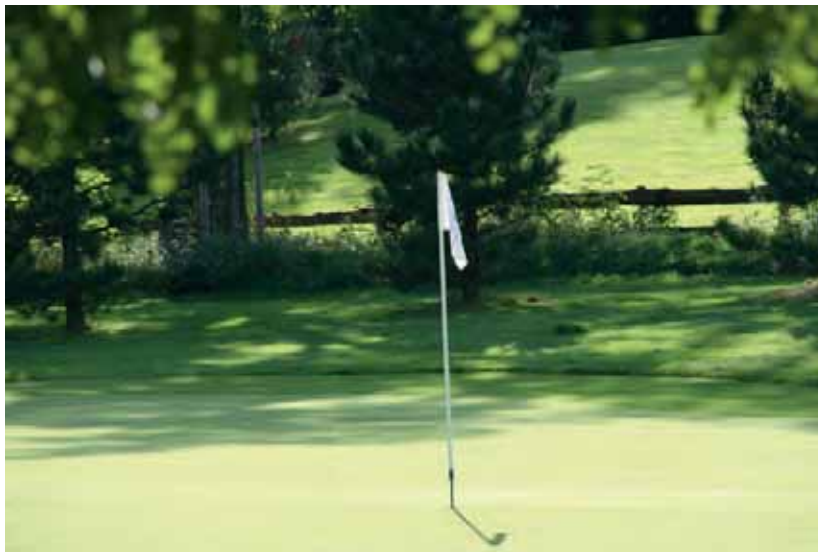
Sogar Petrus hat mitgespielt. Herrlicher Sonnenschein begleitete das 17. Sportwochenende.