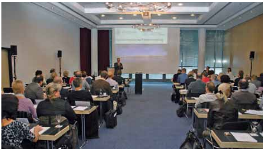
Teilnehmer der KFO-Gutachtertagung im Dorint-Hotel in Potsdam