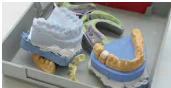
Seite 33 – Die GOZ 2012, speziell zum Abschnitt F „Prothetische Leistungen“ in zehn Fragen