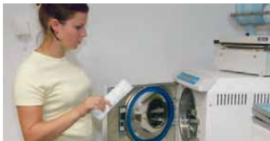
Seite 42 – Am 8. Oktober ist eine neue RKI-Richtlinie in Kraft getreten – die wichtigsten Änderungen kompakt