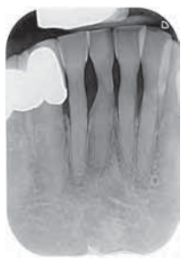
Zähne à la „Biberbaum“ nach extensivem Scaling