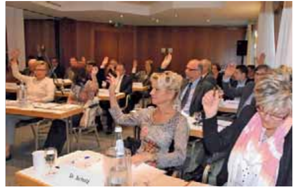
Seite 6 – Erste gemeinsame Bereitschaftsdienstordnung von Kammer und KZV beschlossen