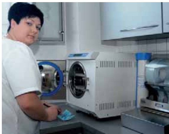
Seite 32 – Ein leider unendliches Thema: Wer darf Medizinprodukte aufbereiten? Mit Fortbildungstipps.