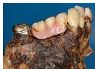
links: Unterkiefer-Übersicht (35, 45-48 für DNA-Untersuchung entnommen)