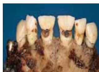
links: Zustand nach WSR bei 34,35,36 mit retrograden Wurzelfüllungen (35 mit NEM-Krone entnommen), NEM-Kronen 36,37