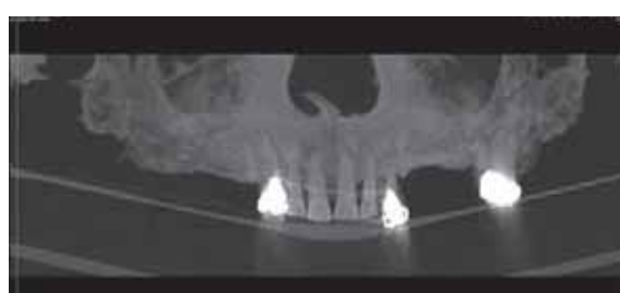
rechts: Detailansicht Klammer 27