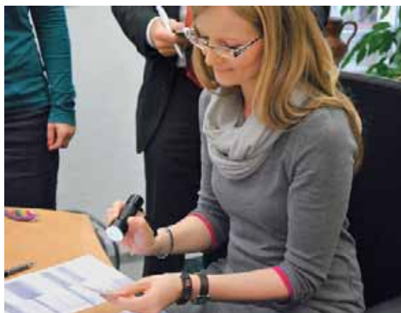
Seite 15 – Alles ist bereit zur Einführung des elektronischen Heilberufsausweises – auch das Ident-Verfahren