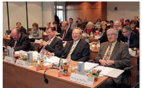
Seite 10 – Die Vertreterversammlung der KZVLB zeigte große Einigkeit in der Beschlussfassung