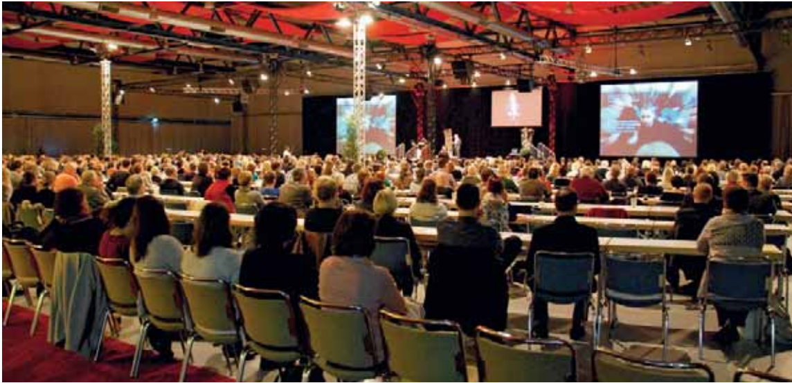
Etwa 900 Zahnärzte und Zahntechniker besuchten das wissenschaftliche Programm