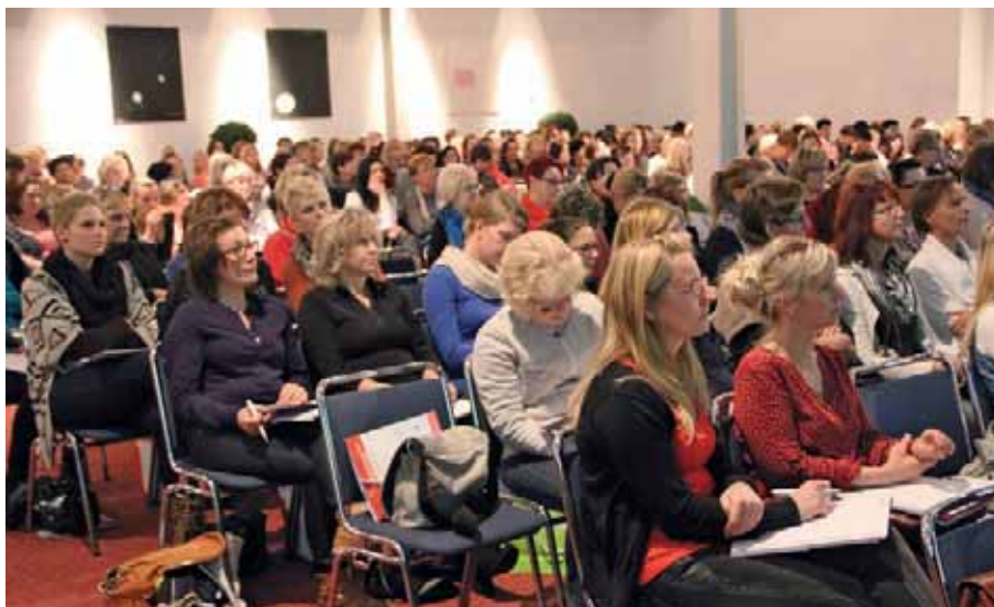
Gespannte Aufmerksamkeit beim Vortragsprogramm für die Zahnmedizinischen Fachangestellten