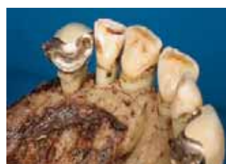
links: Oberkiefer ohne Modellgussanteil von palatinal, Rillen-Schulter-Fräisungen bei 13 und 23; Vollgusskrone 27