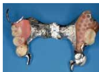
links: Modellgussprothese von oral