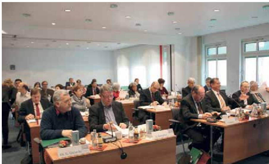
Die 54. Vertreterversammlung der KZVLB tagte am 6. Dezember in Potsdam